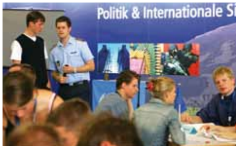
Ausbildung der ersten Jugendoffiziere zu POL&IS Spielleitern