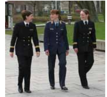
Die ersten weiblichen Jugendoffiziere treten ihren Dienst an