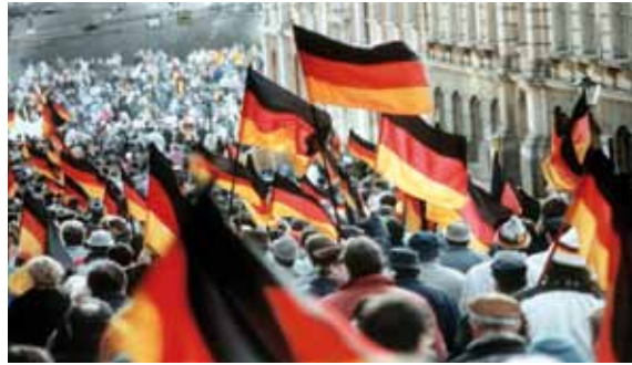
Nach der Wiedervereinigung: Die ersten Jugendoffiziere auch in den neuen Bundesländern