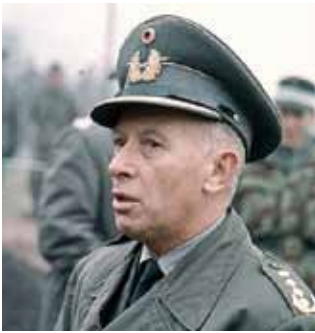
Generalinspekteur Adolf Heusinger beruft die ersten Jugendoffiziere